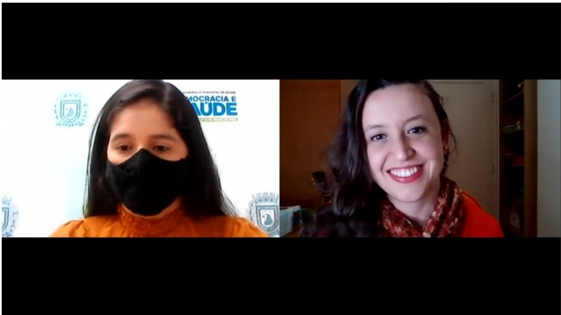
8ª conferência municipal de saúde (1ª etapa - virtual)