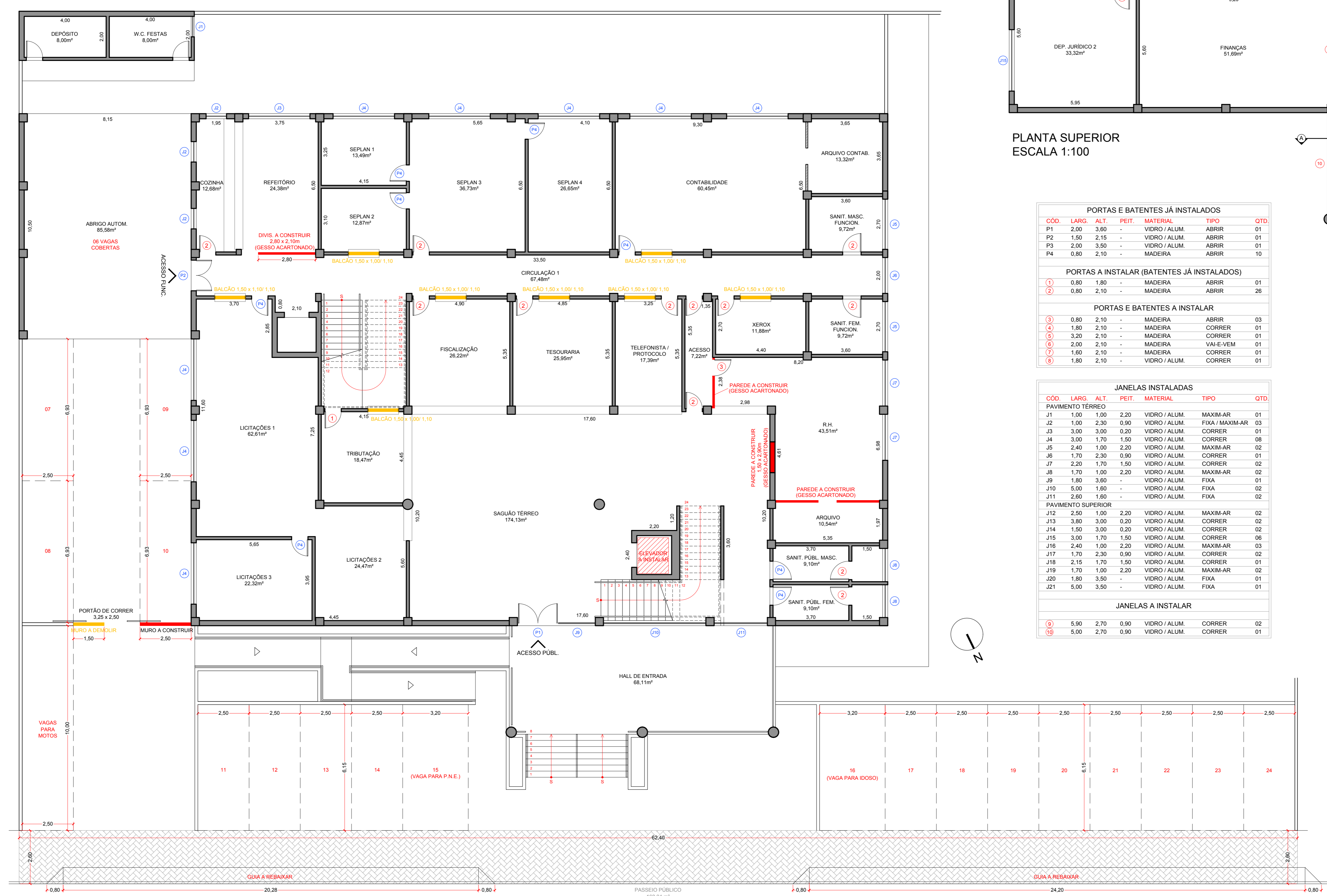
PLANTA TÉRREO ESCALA 1:100