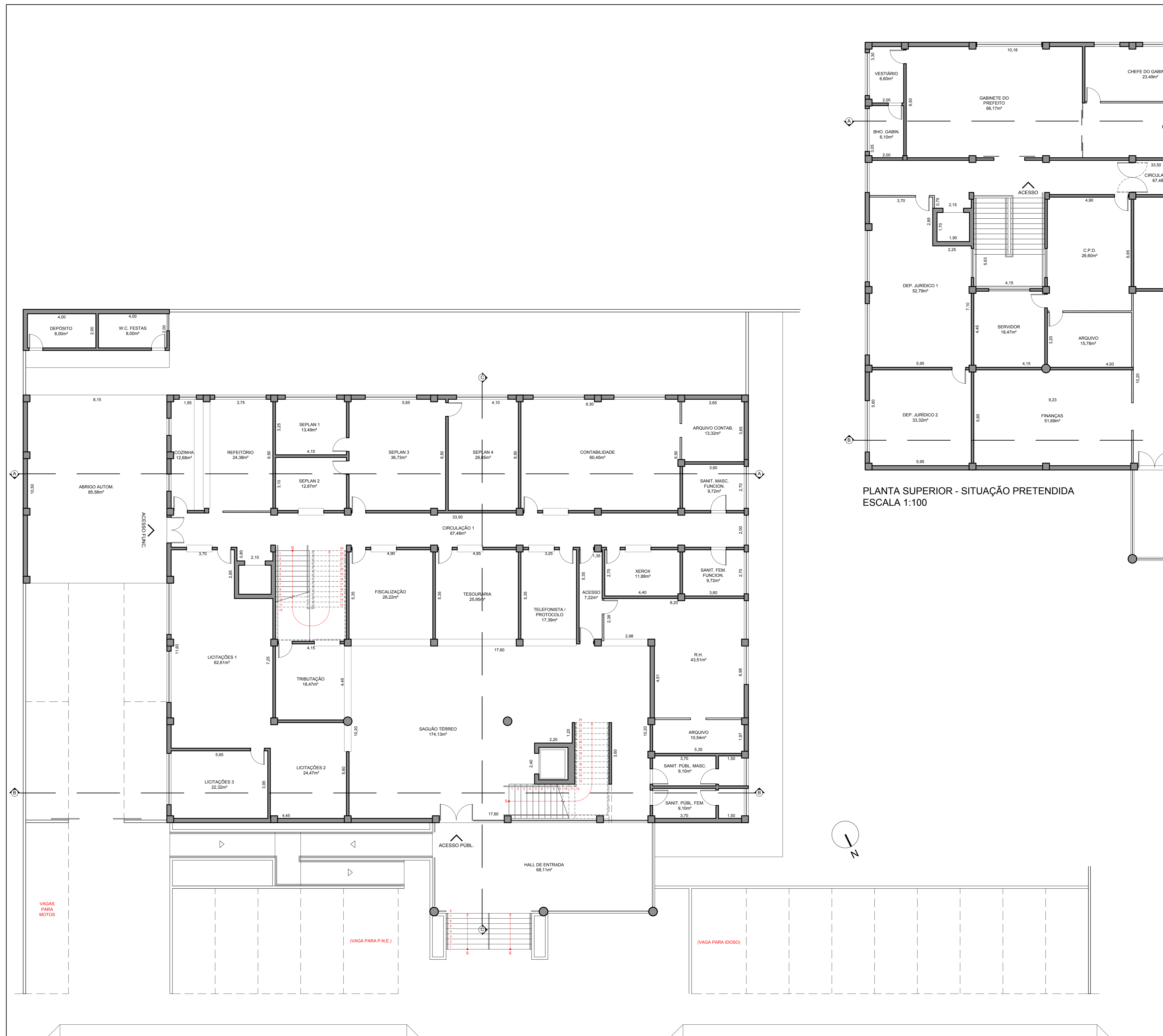
PLANTA TÉRREO - SITUAÇÃO PRETENDIDA ESCALA 1:100