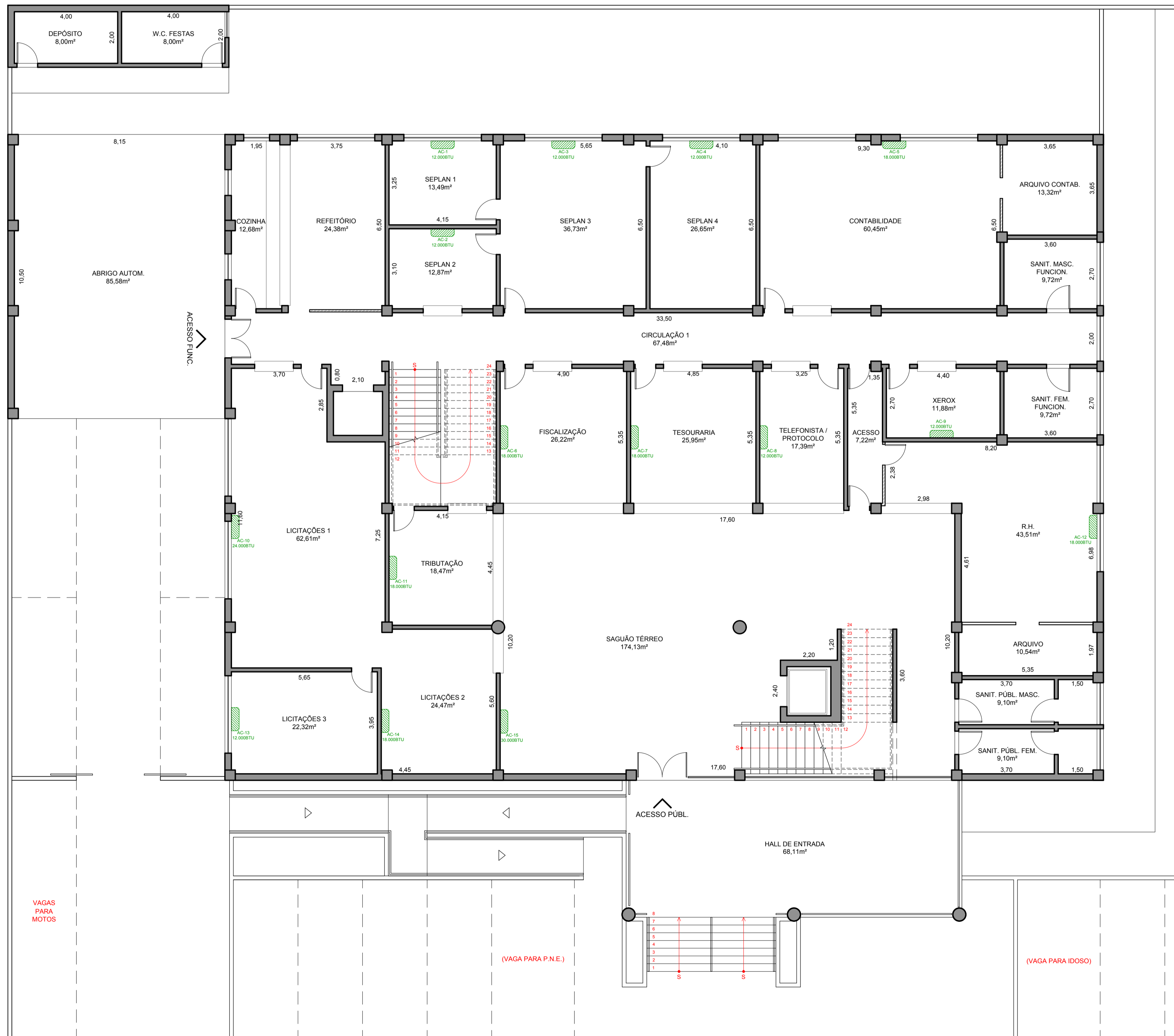
PLANTA SUPERIOR - SITUAÇÃO PRETENDIDA ESCALA 1:100