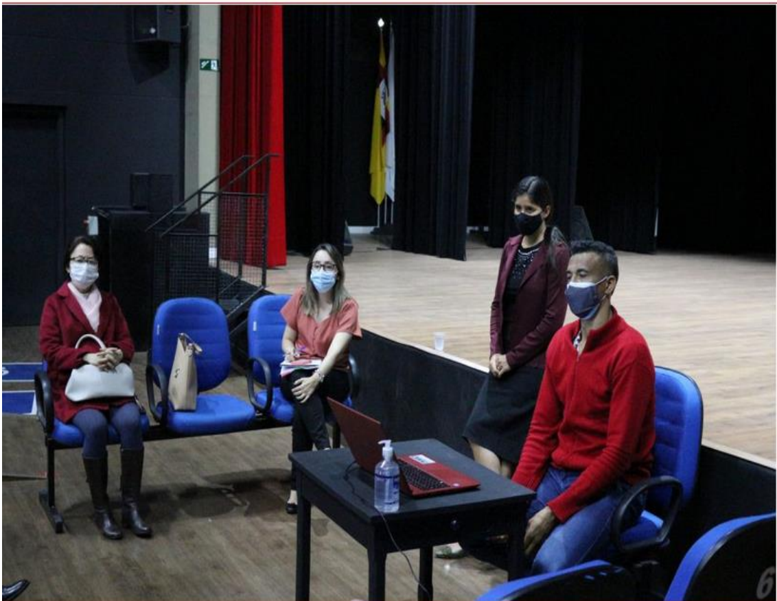
2º Dia da 8ª Conferência Municipal de Saúde - PRESENCIAL