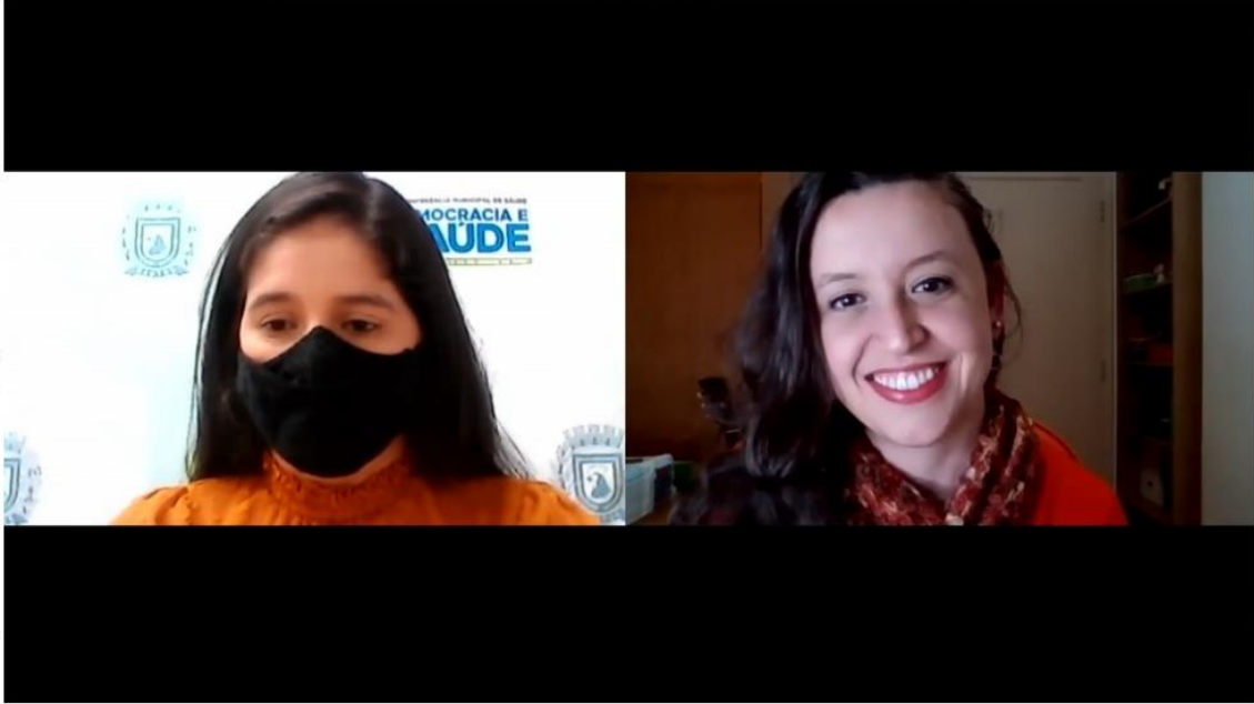
8ª conferência municipal de saúde (1ª etapa - virtual)