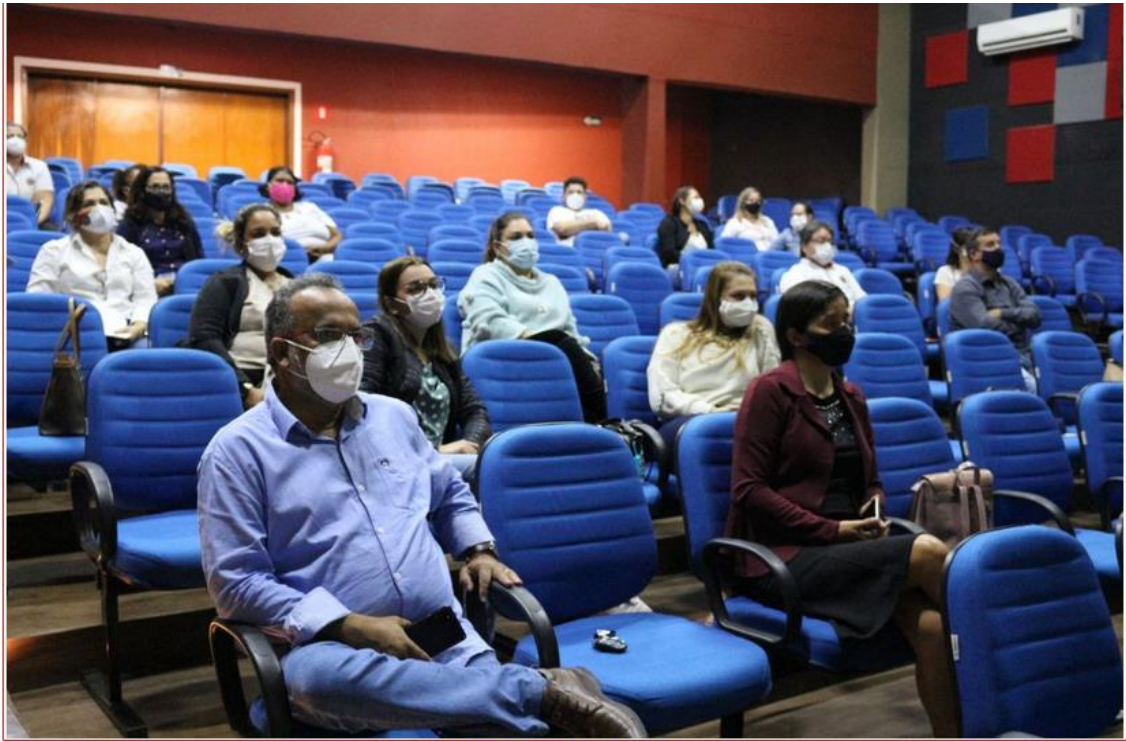
2º Dia da 8ª Conferência Municipal de Saúde - PRESENCIAL