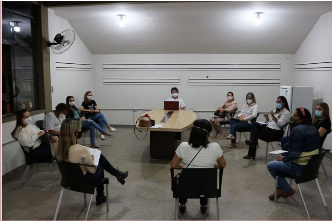
2º Dia da 8ª Conferência Municipal de Saúde - PRESENCIAL