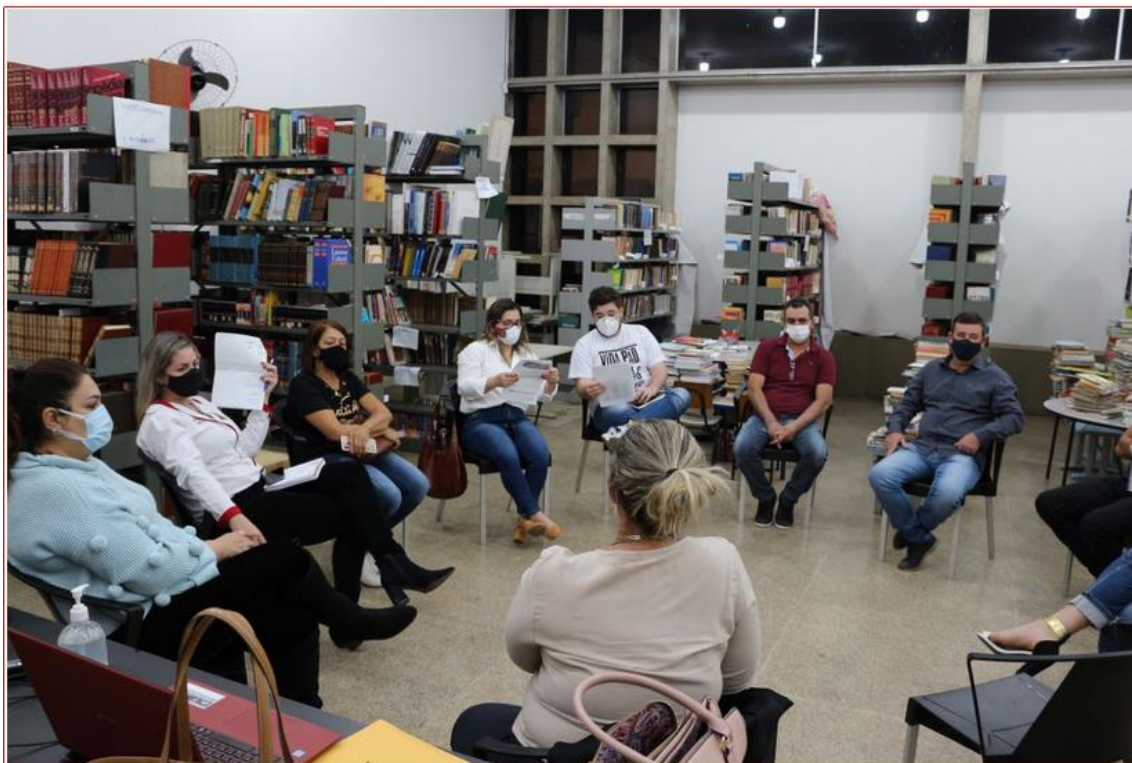
2º Dia da 8ª Conferência Municipal de Saúde - PRESENCIAL