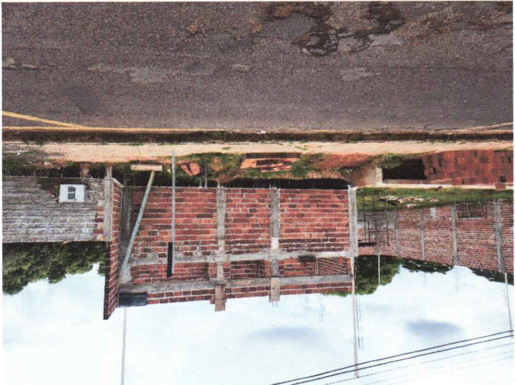
Legenda: Vista Frontal