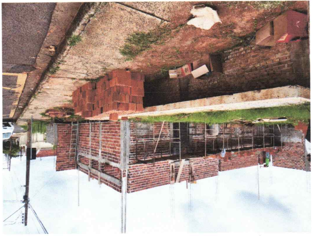
Legenda: Vista frontal