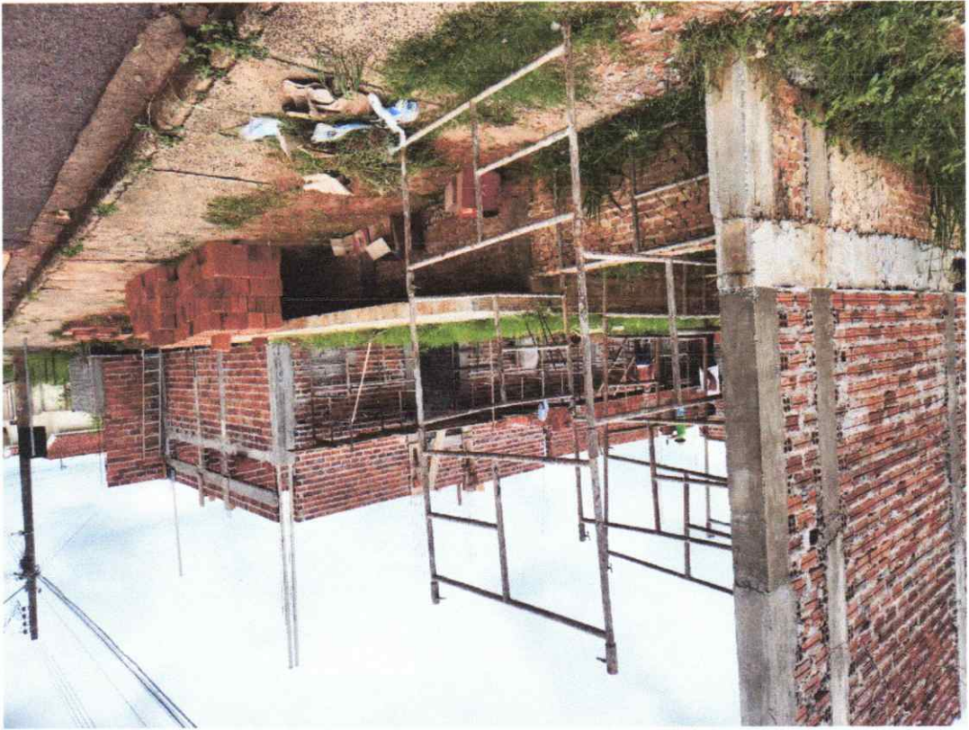
Legenda: Vista Lateral