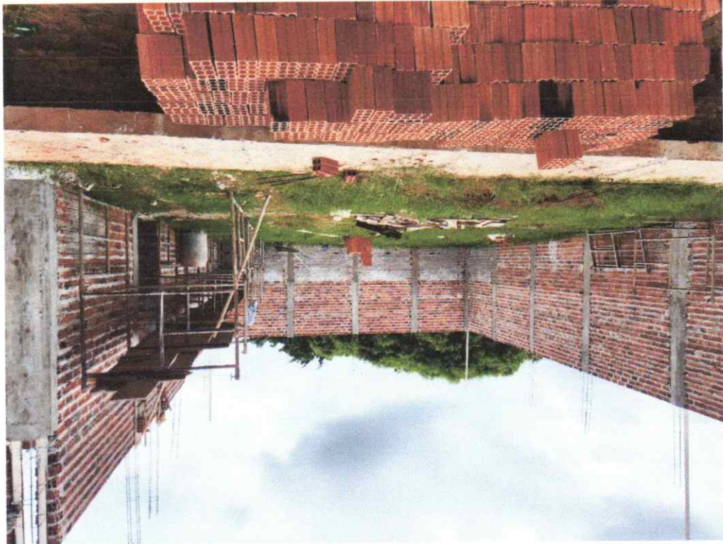
Legenda: Vista frontal