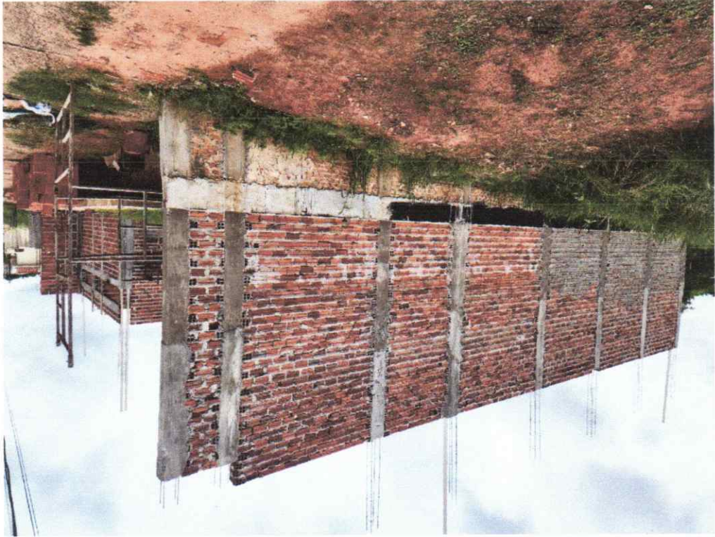
Legenda: Vista Lateral