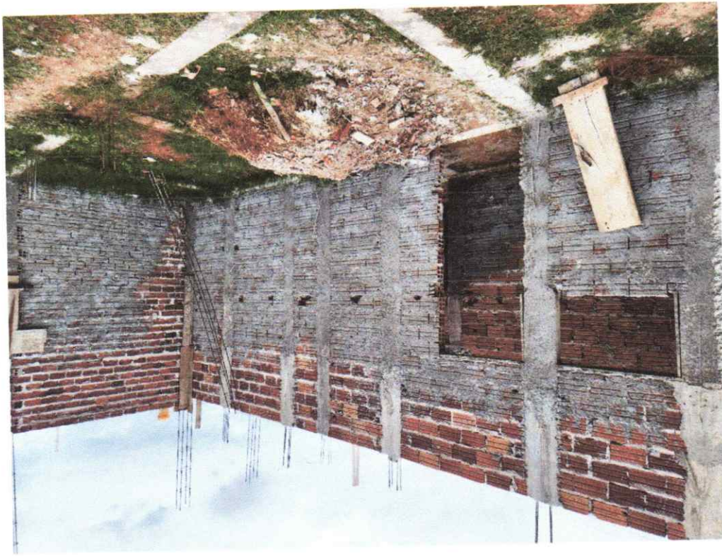
Legenda: Vista Interna