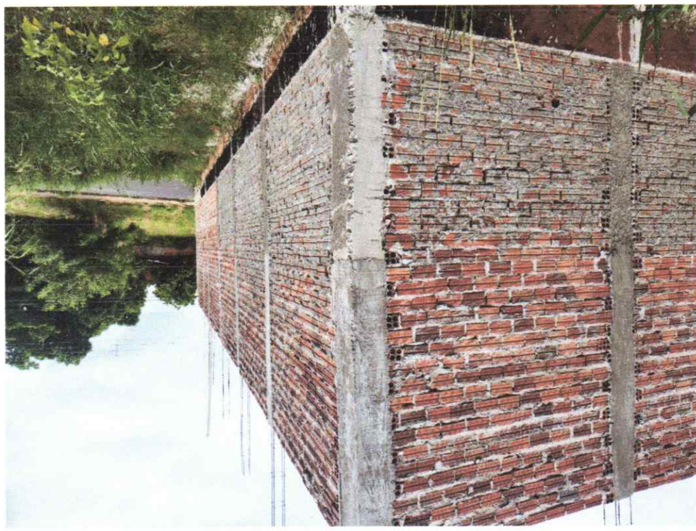
Legenda: Vista Lateral