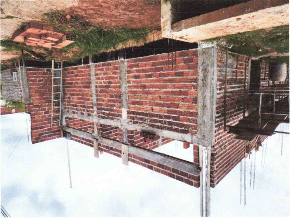
Legenda: Vista Frontal