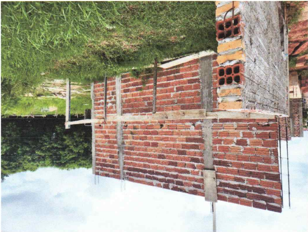
Legenda: Vista Lateral